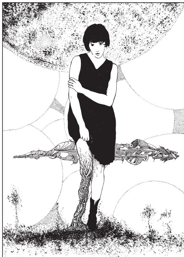
A. Bani, Le mutate condizioni , china su carta, 1997